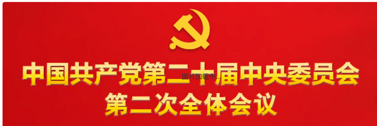
中国共产党第二十届中央委员会第二次全体会议